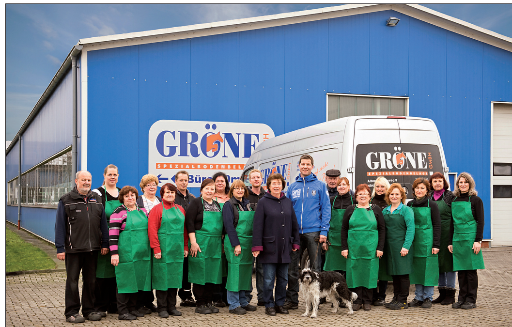
Qualität und Service garantiert: Geschäftsleitung und Mitarbeiter der Gröne GmbH.

Ein zweites Standbein stellt für das Unternehmen die Zusammenarbeit mit dem Werkzeughersteller ITW Heller aus Dinklage dar. Gröne übernimmt die Lagerhaltung von 400 Paletten und die Verpackung und Kommissionierung der Waren, die Werkzeuge können auch mit dem Laser beschriftet oder farblich bedruckt werden.