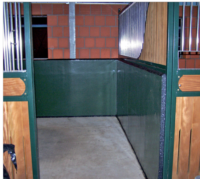
Ausgekleidet: Mit gummierten Böden und Wänden schafft das Unternehmen Gröne GmbH komfortable Pferdeboxen.

Alter Mühlenweg 3 · 49413 Dinklage · Tel. 044 43 / 33 47