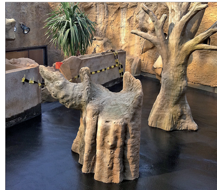
Gestaltete Zoolandschaft: Im Zoo Leipzig schätzt man die tierfreundlichen Produkte von Gröne.